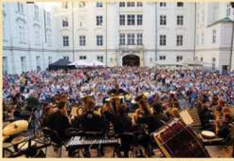
Red Eagles Tirol (R.E.T.)

Einem breiten Publikum mit ihren Konzerten die Werke der Kunstmusik näherzubringen, war schon immer eine zentrale Aufgabe der ältesten österreichischen Blas- und Bläsermusik. Diese Tradition setzen die Innsbrucker Promenadenkonzerte in zeitgemäßer Form fort!